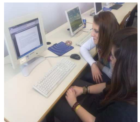
Le due Valentina definiscono l'oggetto.

La società potrà inoltre, in via secondaria e non prevalente: